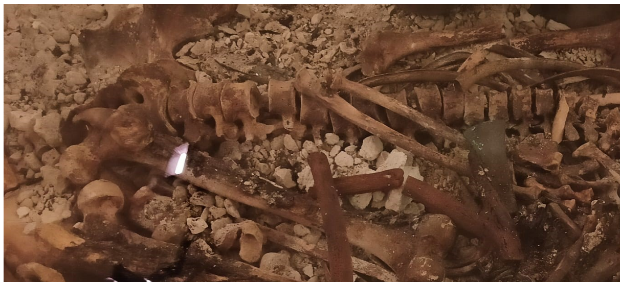
Fotografía de la momia de Galera, en el Museo de Galera.

La sepultura estaba protegida por tres tablones de pino negro ( Pinus nigra ) cubiertos con una capa de barro y un muro de piedra exterior. Este aislamiento impidió la entrada de sedimentos y permitió que las condiciones de sequedad extrema del ambiente detuvieran la actividad bacteriana, logrando una momificación por deshidratación (MOLINA, RODRÍGUEZ-ARIZA, JIMÉNEZ, & BOTELLA, 2003).