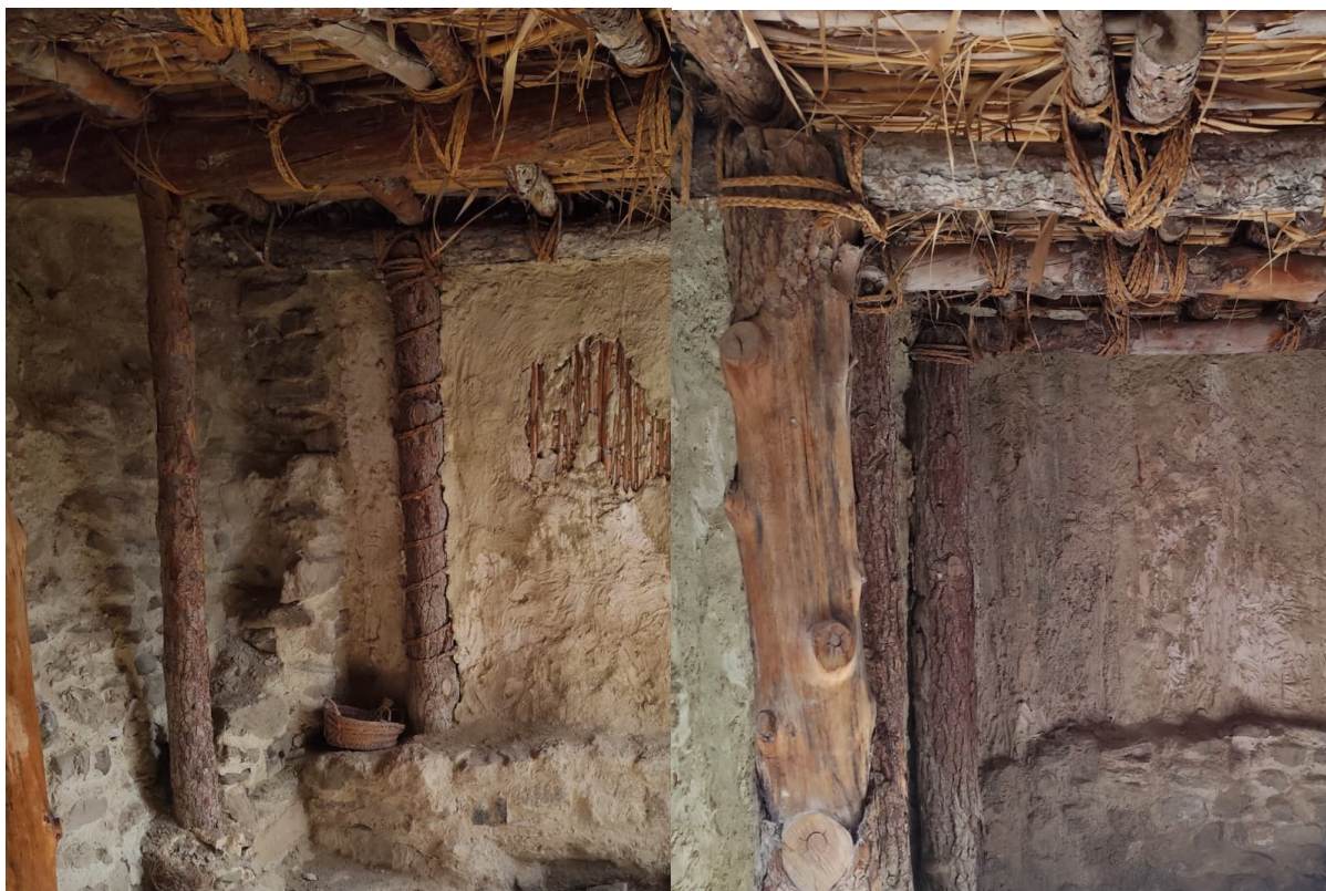
Fotografía de una reconstrucción del interior de una vivienda en el yacimiento de Castellón Alto.