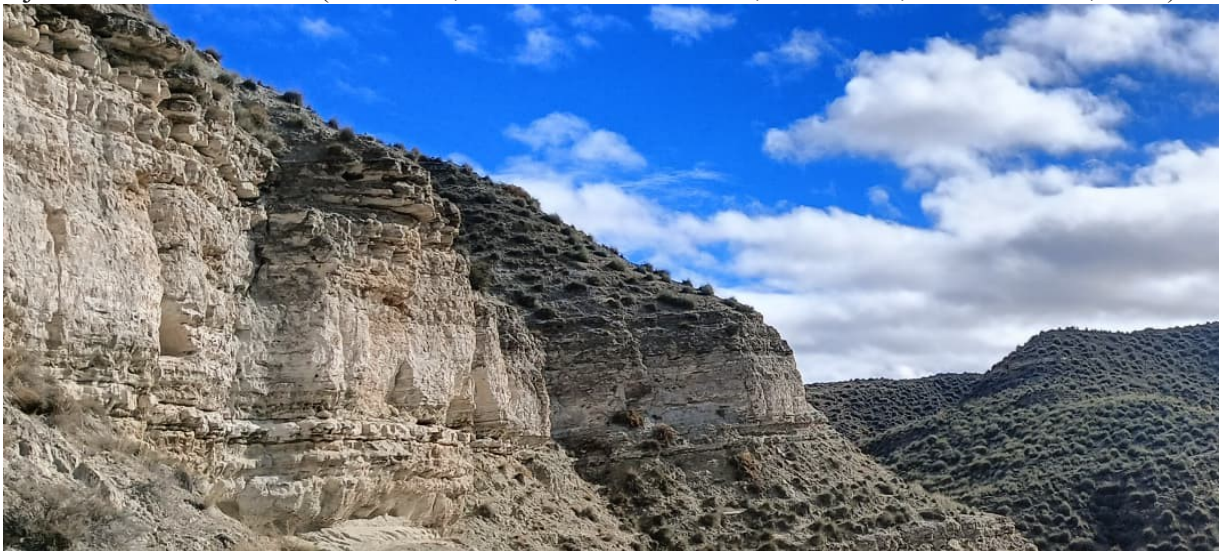
Fotografía del paisaje desde el yacimiento, pudiendo observarse las características geológicas del yacimiento a la izquierda y la flora actual del paisaje circundante a la derecha.

La elección del yeso como sustrato constructivo tuvo implicaciones directas en la arquitectura y la conservación del sitio. Por un lado, la facilidad para excavar la roca permitió la creación de terrazas artificiales y "covachas" (cuevas artificiales para enterramiento). Por otro lado, la naturaleza higroscópica del yeso y la sequedad extrema del clima del altiplano crearon las condiciones perfectas para la preservación de restos orgánicos que normalmente desaparecen en el registro arqueológico, como madera de pino, fibras de lino, esparto y, de manera excepcional, tejidos blandos humanos (MOLINA, RODRÍGUEZ-ARIZA, JIMÉNEZ, & BOTELLA, 2003).