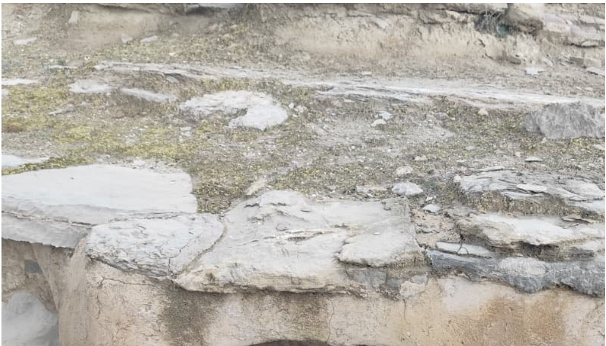
Fotografía a una reproducción de una tumba argárica en el propio yacimiento, fuente desconocida.

La posición del cadáver era casi invariablemente en decúbito lateral flexionado, con las rodillas cerca del pecho, lo que permitía optimizar el espacio en los recipientes y estructuras. El ajuar funerario variaba según el rango: las ofrendas cárnicas (pata de vaca, oveja joven) y la cerámica (copas, cuencos) eran comunes en las tumbas de estatus medio y alto. En las campañas de 2001, se documentaron casos interesantes como la Tumba 88, una inhumación infantil doble con un ajuar que incluía una ollita de cerámica y un punzón de hueso, protegida por una losa y un murete de mampostería.